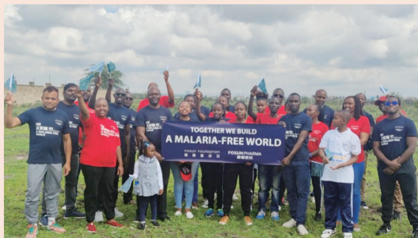
复星医药旗下桂林南药生产的青蒿琥酯注射剂助力建构“A Malaria-free World”

2023恒生可持续发展评估准则参考了国际及本地指引作出更新，重整评估框架，以切合不断演变的ESG趋势。在更严谨的评选标准下，复星国际的恒生ESG评级成绩从A级提至AA-级，企业管治、环境、消费者事宜、社区参与和发展四项议