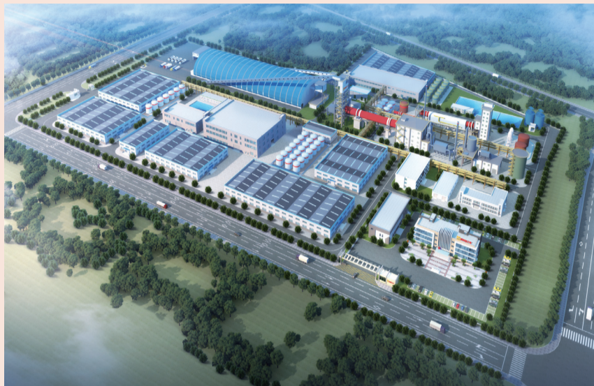
海南矿业氢氧化锂项目所在的儋州市洋浦新材料产业园效果图

2019年6月，海南矿业收购澳大利亚洛克石油51%股权，业务布局从铁矿石拓展至“铁矿石+油气”。洛克石油总部位于澳大利亚，具有20多年油气作业经验，涵盖上游全周期业务。2022年9月30日为基准日，洛克