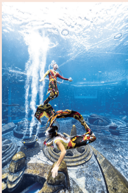
团体赛选手参赛中