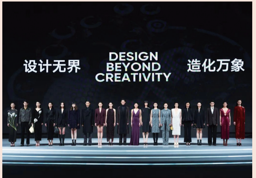
LANVIN 首次使用 AIGC 技术，在线下走秀同时，线上举办元宇宙秀场

东家、WEI蔚蓝之美、老城隍庙等品牌原创，涵盖腕表、工艺品、化妆品、饮食等产品和包装设计。