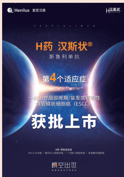
H药汉斯状®食管鳞状细胞癌获批上市

同时，为加强H药的全球化推广，复宏汉霖于9月12日扩大与印度尼西亚制药公司PT Kalbe Farma Tbk.（以下简称“Kalbe”）旗下控股子公司PT Kalbe Genexine Biologics（以下简称“KGbio”）的独家许可与商业化合作，授予其在沙特阿拉伯、阿联酋、埃及、卡塔尔、约旦、摩洛哥等12个中东和北非地区(MENA)国家对复宏汉霖自主开发的抗