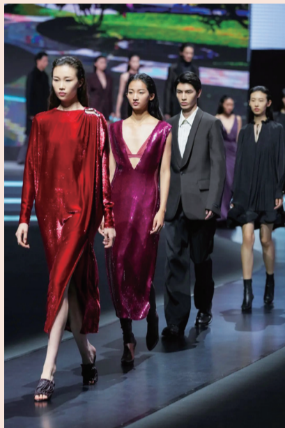
LANVIN 首次使用 AIGC 技术，在线下走秀同时，线上举办元宇宙秀场

开幕式后，9月29日中秋节，复星担任会长单位的上海国际时尚联合会举办东方生活美学专场“上海·米兰-双城映画”，作为9月8日米兰举行的SHANGHAI FASHION DAY（上海时尚日）成果延