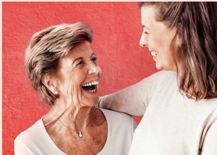
复星葡萄牙保险国际总保费同比增长19.4%至8.32亿欧元，突显其国际多元化战略优势

安信国际还认为复星富足板块保险业务规模稳中有升，可投资资产规模稳定，盈利水平提升。葡萄牙保险总保费收入26.5亿欧元，占葡萄牙市场总额30%；拉