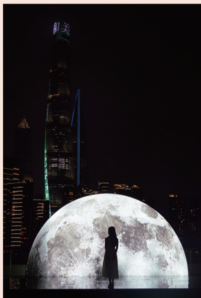
外滩最美露台“超级月亮”装置艺术

BFC FITNESS健身会馆也为运动爱好者提供了秋日时髦塑身指南。9月，BFC FITNESS健身会馆也将迎来五周年店庆，店庆活动期间到店会员可享多重好礼。时尚季开幕当天，健身会馆特别联合6位明星导师，为会员带来能量流、动物流、ZUMBA、SHBAM等不同课程体验，开启秋日完美体态训练，将时髦进行到底。