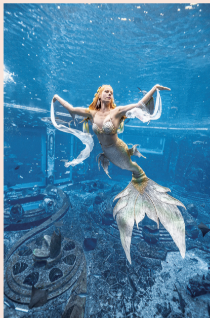
美人鱼大赛首次出现海外选手