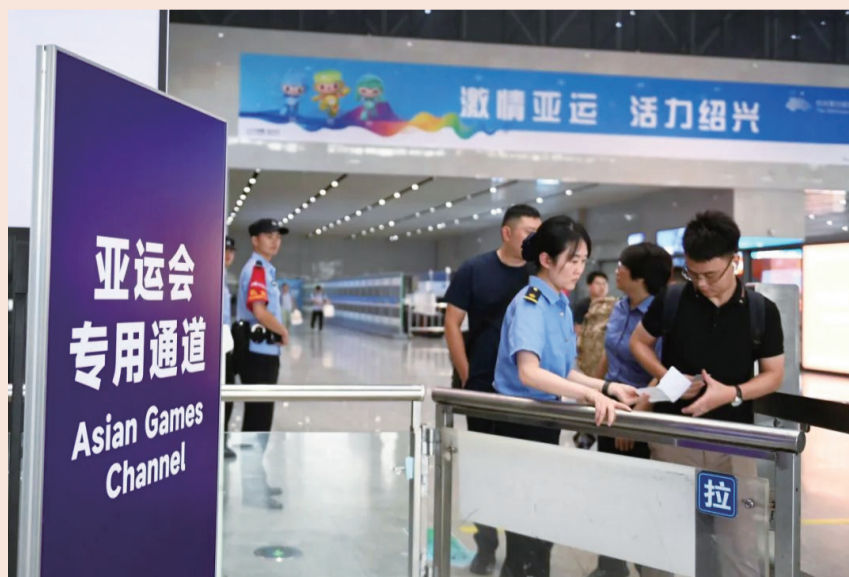
杭绍台铁路绍兴北站设置亚运专用通道，精细化满足亚运出行需求

象，杭绍台铁路积极开展迎亚运提档升级工作，对沿线车站候车大厅、进出站口及各类标识标牌进行全面改造。杭绍台铁路