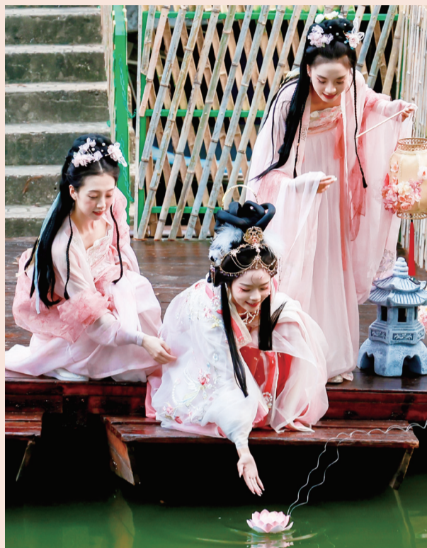
豫园沉浸式仲秋月神游中的“仙子”

一年有12次月圆，但是叫中秋的月圆，一年只有一次。每次这轮月照升起的时候，我们都能听到李太白听到过的“万户捣衣声”，都能闻见白乐天闻见过的“天香云外飘”，也都会发问苏东坡发问过的“把酒问青天”。人生代代无穷已，江月年年望相似，月之圆兆，人之团圆，千百年来，中秋佳节传承着中国人对“圆满”的美好祈盼。值此月圆之际，又恰逢2023上海旅游节启幕，豫园商城再度升级节气江南IP，倾力打造2023新版“仲秋月神游”活动，邀请各方宾朋共赴秋月古风浪漫，共享中国文化之美。