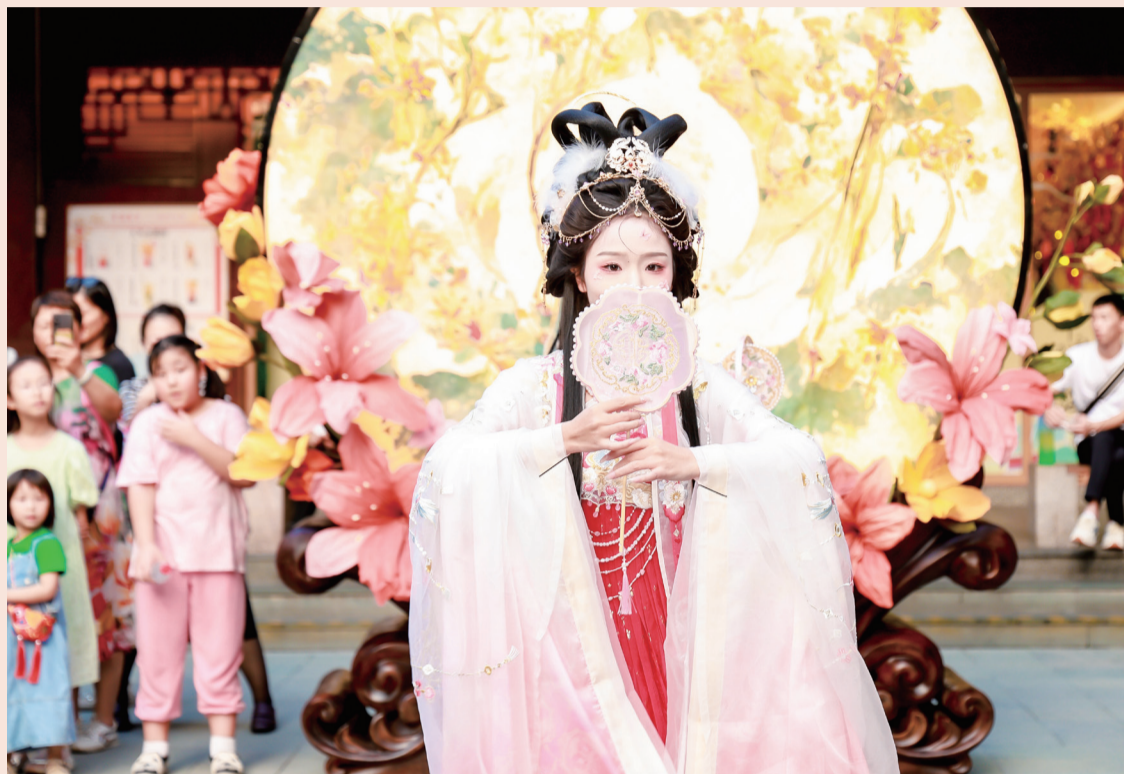
豫园商城中心广场上，“月神”起舞