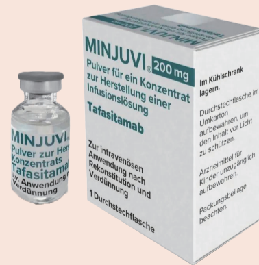
在禅医可使用到的新药械（部分）

临床还是在科研上已实现了新的跨越，迈入国内前列水平。膏方制作工艺及临床应用经过多年的积累和不断突破，探索出一条满足现代生活方式需求的中药饮片剂型改革之路。