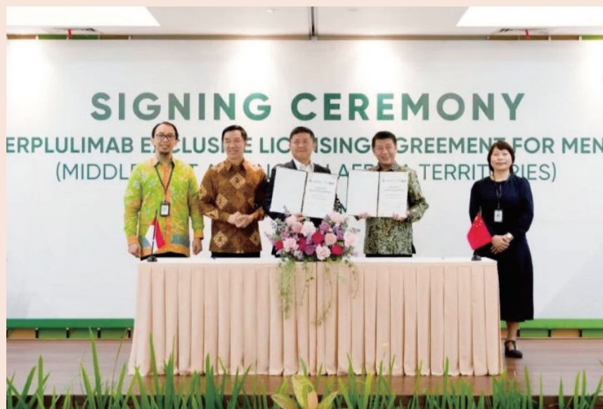
复宏汉霖与 KGbio 签约

9月22日，复宏汉霖宣布，公司自主研发的创新抗PD-1单抗H药——汉斯状®（通用名：斯鲁利单抗注射液）联合含氟尿嘧啶类和铂类药物用于PD-L1阳性的不可切除局部晚期/复发或转移性食管鳞状细胞癌(ESCC)的一线治疗新适应症的上市注册申请(NDA)获得国家药品监督管理局批准，为食管鳞癌患者提供了治疗新选择。