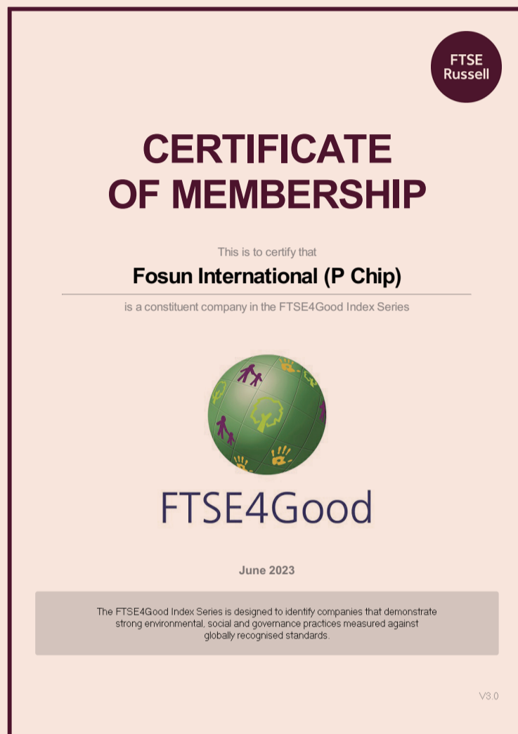
复星国际 2023 富时罗素评分提升

力。截至目前，复星国际恒生ESG评级为AA-，并于2023年首次入选恒生可持续发展企业指数成份股；MSCI ESG评级为AA，是大中华地区唯一一家MSCI ESG评级为AA的综合型企业；标普全球企业可持续发展评估成绩排名超过91%的全球同业，入选标普全球《可持续发展年鉴2023（中国版）》及获颁“行业最佳进步企业”标徽。